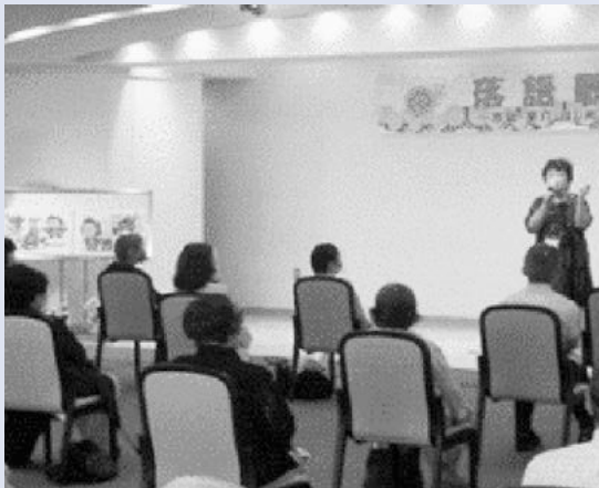
【落語歌会での啓発】

港南区では、横浜市長からの委嘱を受け、118名（令和3年8月現在）の消費生活推進員が区内の15地区で活動しています。